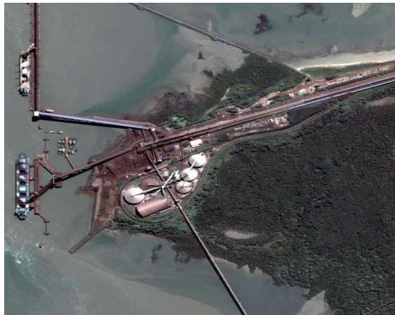
Infra-estrutura portuária da Companhia Vale do Rio Doce em São Luiz (MA)

uma tecnologia que pode ser usada para monitorar movimentos súbitos no terreno a partir de sensores a bordo de satélites ou aeronaves. Medições de movimentação da superfície com acurácia milimétrica são possíveis através deste sistema. Essa tecnologia pode ser aplicada com sucesso na maioria das regiões, incluindo regiões tropicais.