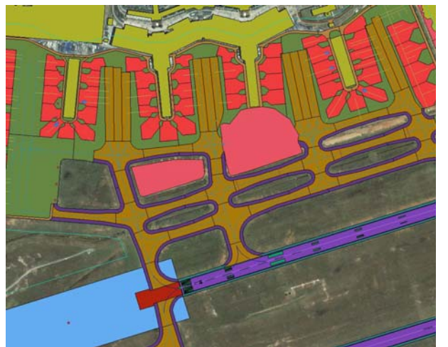
Aeroporto de Guarulhos.